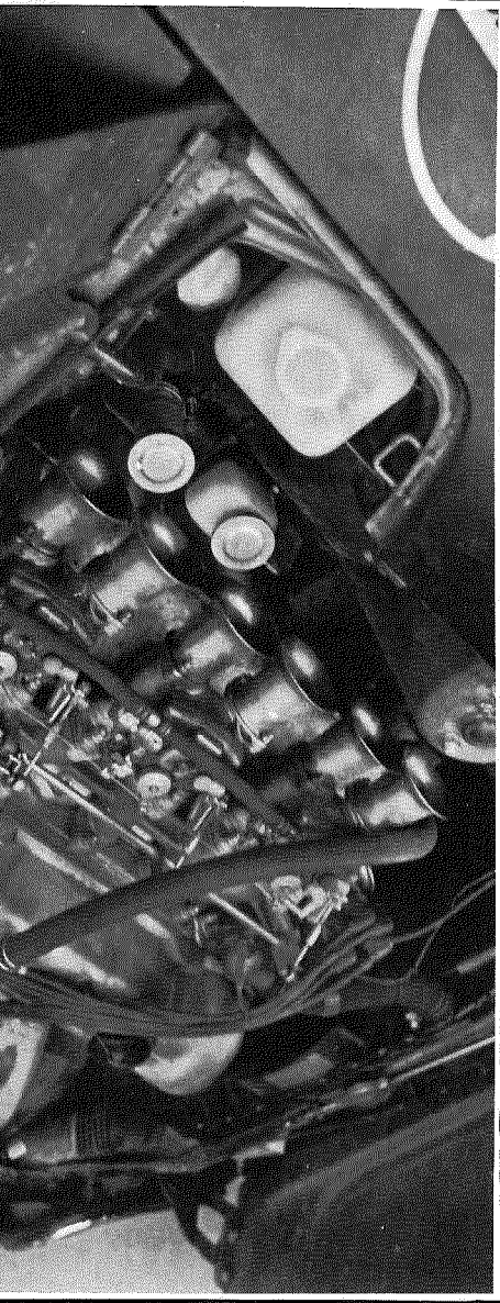
breuses, et l'usine n'a pas fait les choses à moitié: après le travail de la culasse, de l'arbre à cames, de l'alimentation (3 Solux «Japan» double corps de 42), de l'échappement (tubulure en tube d'acier), le moteur développe la bagatelle de 230 ch DIN à 6500 tr/mn. Une boîte 5 vitesses (homologuée) est montée, la suspension subit des aménagements compétitifs: amortisseurs durs, abaissément général. Un léger gain de poids est obtenu par les moyens classiques tels que portières et capots plastiques, garnitures intérieures supprimées, plexi latéraux, etc.

de Datsun ne révèle ses détails techniques qu'au compte-goutte. Six cylindres en ligne de 2400 cc, le bloc Nissan comporte un arbre à cames en tête et développe environ 150 ch DIN pour un poids dépassant la tonne. Puis, la presse la découvre lors du déroulement du R.A.C. Bien qu'excellent-ment conduite par le Finlandais et Tony Fall, la voiture n'obtient que des classements moyens, car sa tendance sous-vireuse la rendait peu maniable sur les terrains glissants rencontrés à travers la Grande-Bretagne. Dans sa version compétition, les améliorations sont nom-